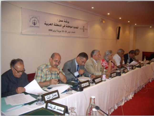
ممثلي المجتمع المدني يشاركون في "ورشة التخطيط لحركة مواطنة في المنطقة العربية"، مدينة الحمامات، تونس

نظم مركز الكواكبي للتحوّلات الديمقراطية ورشة عمل تهدف إلى تأسيس تحالف ممثلي المجتمع المدني وترمي إلى إعداد "نداء المواطنة" في المنطقة العربية وذلك في إطار العمل على تنفيذ أهداف مشروع المتعلق "بحركة مواطنة في المنطقة العربية" . وقد التّأمت الورشة يومي 25 و 26 جويلي/تموز 2008 بالشراكة مع المؤسسة العربية للديمقراطية والمعهد