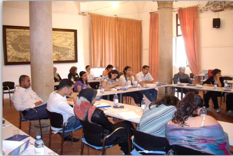
المشاركون في التدريب حول "الديمقراطية و الحكم الجيد في المنطقة العربية"، البنديقية